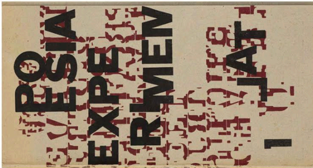
POESIA EXPERIMENTAL 1 | primeiro caderno antológico de poesia experimental org: ANTÔNIO ARAGÃO, HERBERTO HELDER | edição de autor ANTÔNIO ARAGÃO, 1964

A POESIA EXPERIMENTAL PORTUGUESA nunca foi um movimento de vanguarda ou publicou um manifesto, nunca promoveu a participação dos poetas por convite, nunca aceitou um porta voz ... mas tem aglutinado desde o seu aparecimento um investimento contínuo de pesquisa por parte dos Poetas na PROBLEMATIZAÇÃO DA INVENÇÃO