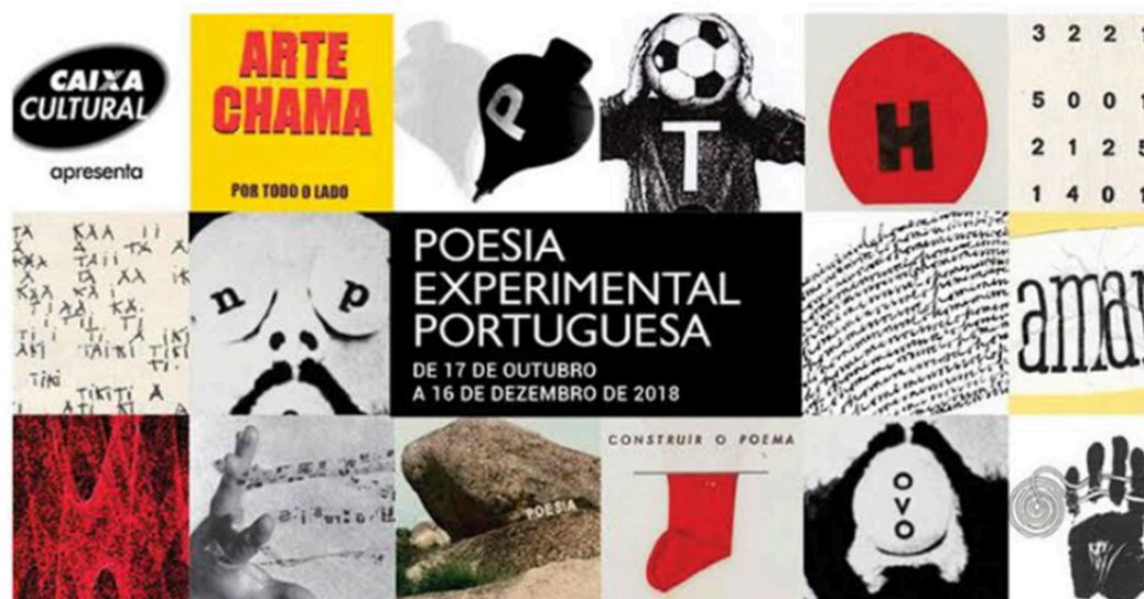
portmenor capa catálogo exposição | edição Espaço Líquido | Brasília 2018

afirmação de ERNESTO MELO E CASTRO por ocasião da inauguração da exposição "Poesia Experimental Portuguesa" na Caixa Cultural, em Brasília 16 de Outubro de 2018